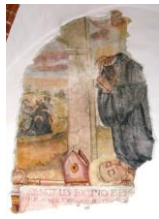
Bruno von Querfurt wurde von heidnischen Preußen getötet.

Er war der erste deutsche Schriftsteller, der nicht nur über die Kiewer Rus geschrieben, sondern sie auch besucht hat. Er stammte aus einem vornehmen sächsischen Geschlecht und gehörte zur nächsten Umgebung des Kaisers Otto III. Unter dem Namen Bonifatius als Mönch eingekleidet und von Missionseifer beseelt, nahm er sich vor, das Kreuz unter die Heiden zu tragen.